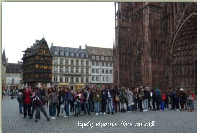
Εμείς είμαστε όλοι αυτοί!!!

Η επόμενη μέρα μάς επιφύλασσε έναν βροχερό καιρό. Οι εναλλαγές του καιρού ήταν απρόβλεπτες και οι θερμοκρασίες, κυρίως, χαμηλές. Έτσι, τα λιθόστρωτα δρομάκια της πανέμορφης Χαιδελβέργης γέμισαν με πολύχρωμες ομπρέλες και οι στάλες της βροχής έκαναν τα κτήρια και την υπέροχη φύση να λάμπουν!